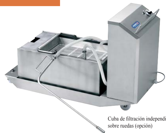
Cuba de filtración independiente sobre ruedas (opción)