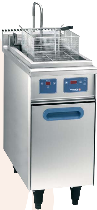
FR 30 E HP - RF con opción elevador automático 1 cestillo

Resistencia blindada de acero inoxidable, articuladas, basculantes, para una fácil limpieza y reguladas por un termostato electrónico con mandos sensitivos, limitando la temperatura del baño de aceite a 180 °C.