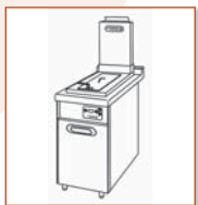
FR 18 G HP - RF FR 25 G HP - RF