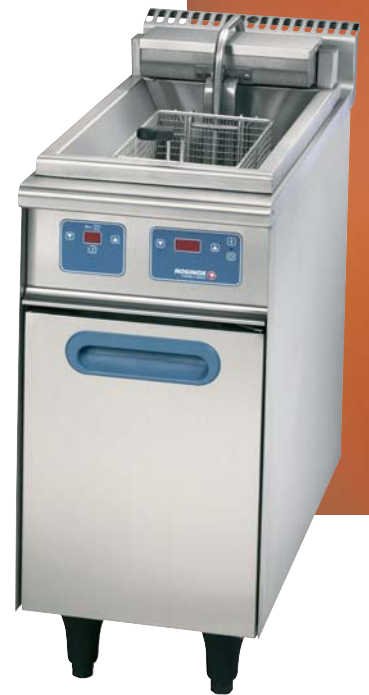
FR 15 E HP - RF con opción elevador automático 1 cestillo