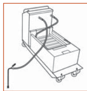
CUBA DE FILTRACIÓN SOBRE RUEDAS