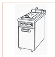
FR 15 E HP - RF FR 30 E HP - RF